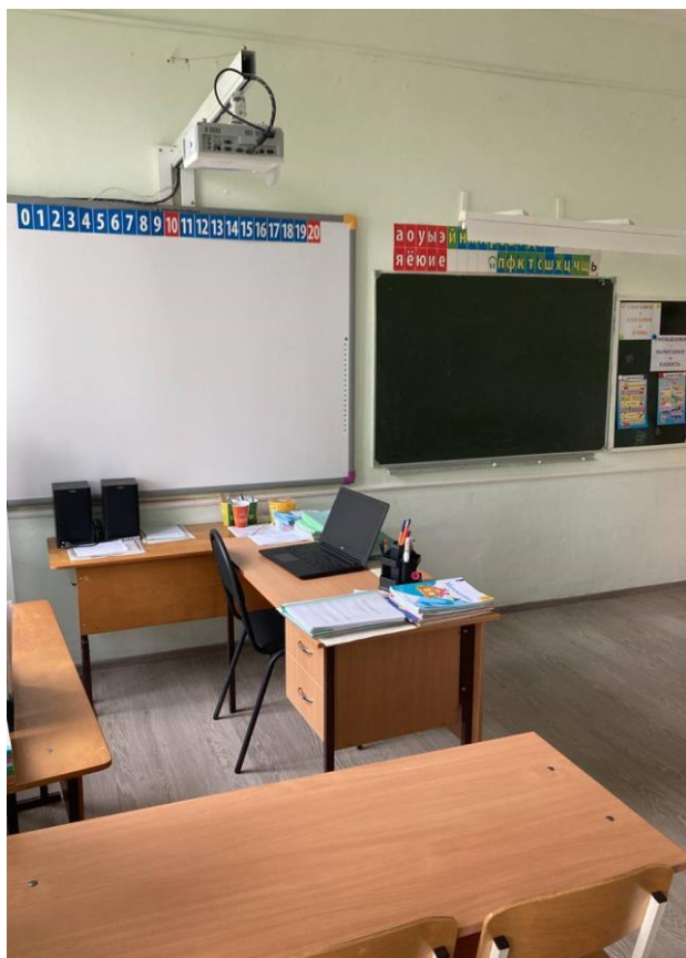
Автоматизированное рабочее место учителя