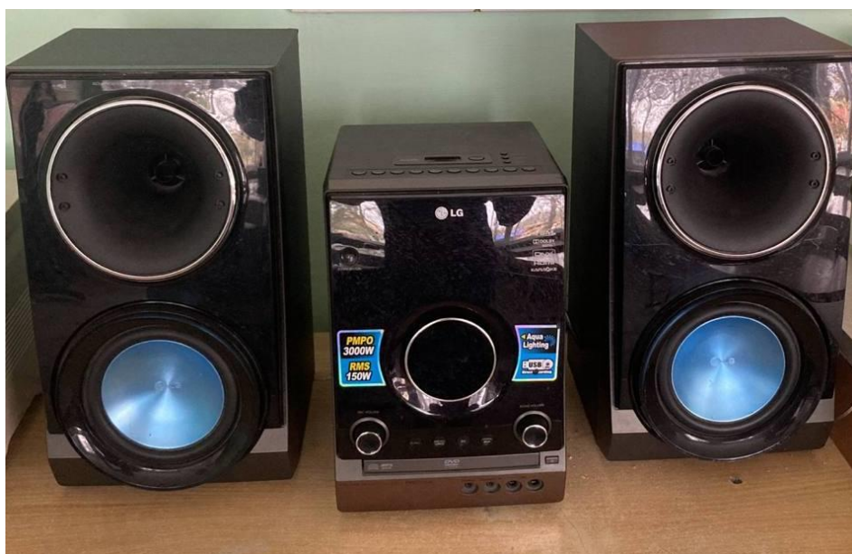
Музыкальный центр для кабинета иностранного языка